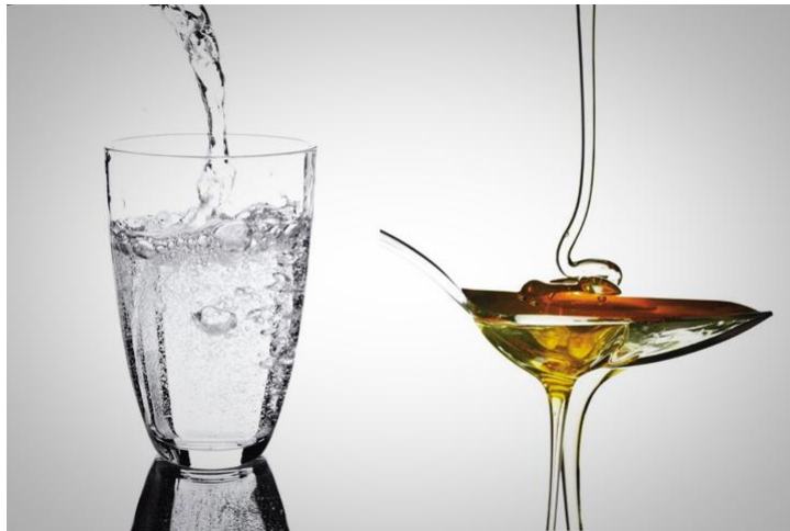
Imagen 2. Agua y miel, dos fluidos con distinta viscosidad

En un fluido en movimiento se puede medir su viscosidad: resistencia a las deformaciones graduales producidas por tensiones cortantes o de tracción. Es una propiedad física de todos los fluidos, fruto de las colisiones entre las partículas del mismo que se mueven a distintas velocidades, provocando una resistencia a su movimiento. Si la viscosidad fuera nula se denomina fluido “ideal”.