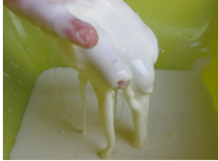
Imagen 1. Consistencia adecuada de la mezcla agua-harina de maíz