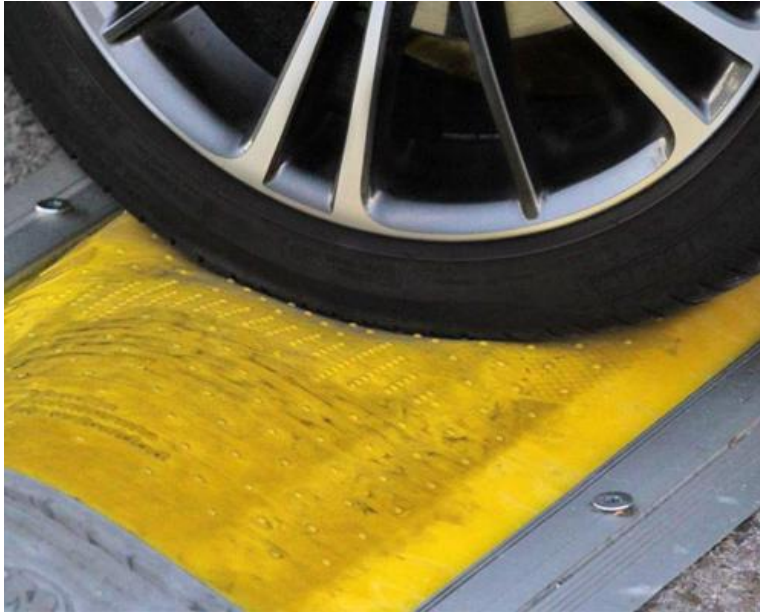
Imagen 10. Badén Inteligente de velocidad (BIV) con fluido no newtoniano

( https://www.youtube.com/watch?time_continue=73&v=2fng6gCjI58&feature=emb_logo )