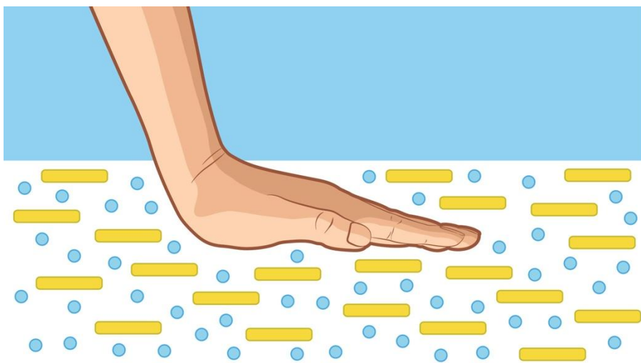
Imagen 4. Partículas de harina de maíz (amarillo) rodeadas de agua (puntos azules)

En el caso de la harina de maíz, lo que sucede es que es una suspensión, la harina no está disuelta, sino que sus partículas se encuentran rodeadas de agua, lubricadas. Si la tensión es débil, la lubricación permite el movimiento con una resistencia muy baja, por ello el movimiento no presenta resistencia (Imagen 4). Sin embargo, si la tensión es alta, el agua se retira de la harina, dejando una red sólida, con una alta fricción en el movimiento de unas partículas respecto a otras, y por lo tanto la resistencia al movimiento es alta, y se comporta como un sólido (Imagen 5).