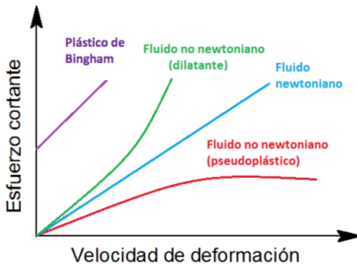
Imagen 6. Comportamiento de fluidos no newtonianos (en verde, rojo y morado)

No todos los fluidos no newtonianos se comportan del mismo modo cuando se les aplica una tensión: algunos se vuelven más sólidos (dilatante) y otros más fluidos (pseudoplástico). Los plásticos de Bingham se comportan como sólido hasta un cierto valor umbral de tensión cortante, a partir del cual se comienza a fluir (Imagen 6).