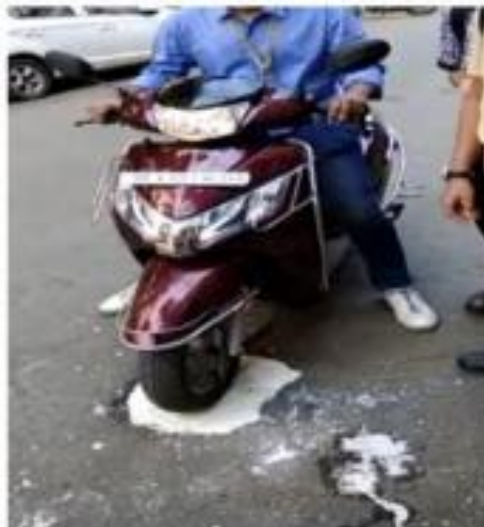
Imagen 9. Fluido no newtoniano en un bache

Otra aplicación es en la reparación de baches. El fluido presenta una mayor viscosidad con la tensión que los vehículos ejercen al pasar sobre él.