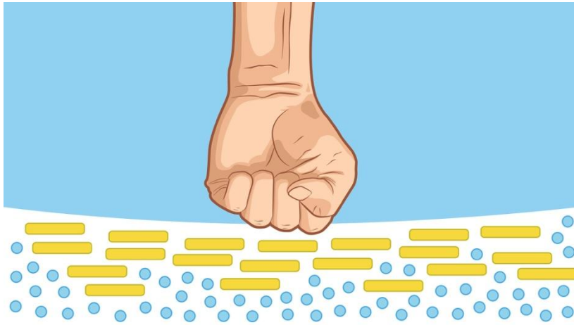
Imagen 5. Comportamiento de la harina de maíz (amarillo) frente a una tensión

No todos los fluidos no newtonianos se comportan del mismo modo cuando se les aplica una tensión: algunos se vuelven más sólidos (dilatante) y otros más fluidos (pseudoplástico). Los plásticos de Bingham se comportan como sólido hasta un cierto valor umbral de tensión cortante, a partir del cual se comienza a fluir (Imagen 6).