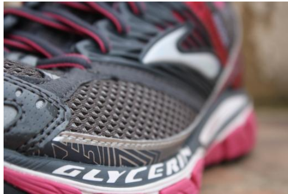
Imagen 8. Zapatilla con suela de glicerina (fluido no newtoniano)

También se emplea en las protecciones empleadas en deportes extremos como el snowboarding o el skateboarding, armaduras corporales (productos de entrenamiento de artes marciales, por ejemplo) ,en el automovilismo, paracaidismo y atletismo. Son productos livianos al realizar el deporte, pero se endurecen en el caso de recibir un impacto. Se está diseñando calzado con sistema de absorción de impactos, lo cual mejora el agarre y la tracción.